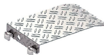
Afdichtingsvlonder voor pasvak art.nr. 3868.032