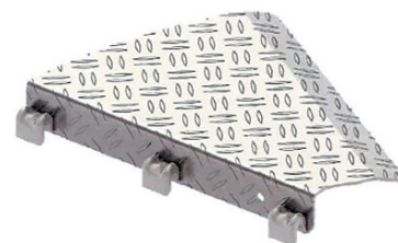
Afdichtingsvlonder hoek art.nr. 3868.000