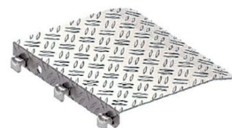
Afdichtingsvlonder voor pasvak art.nr. 3868.061