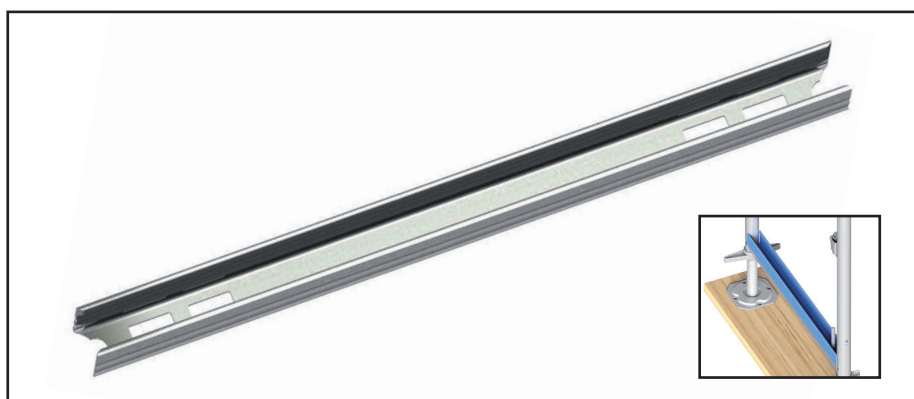
Blitz U-beginprofiel, 0,73 m

Hiermee zijn later vloeren aan te brengen en kunnen ladders van passagevlonders worden ondersteund op plaatsen waar eigenlijk nog geen vloer aanwezig was.