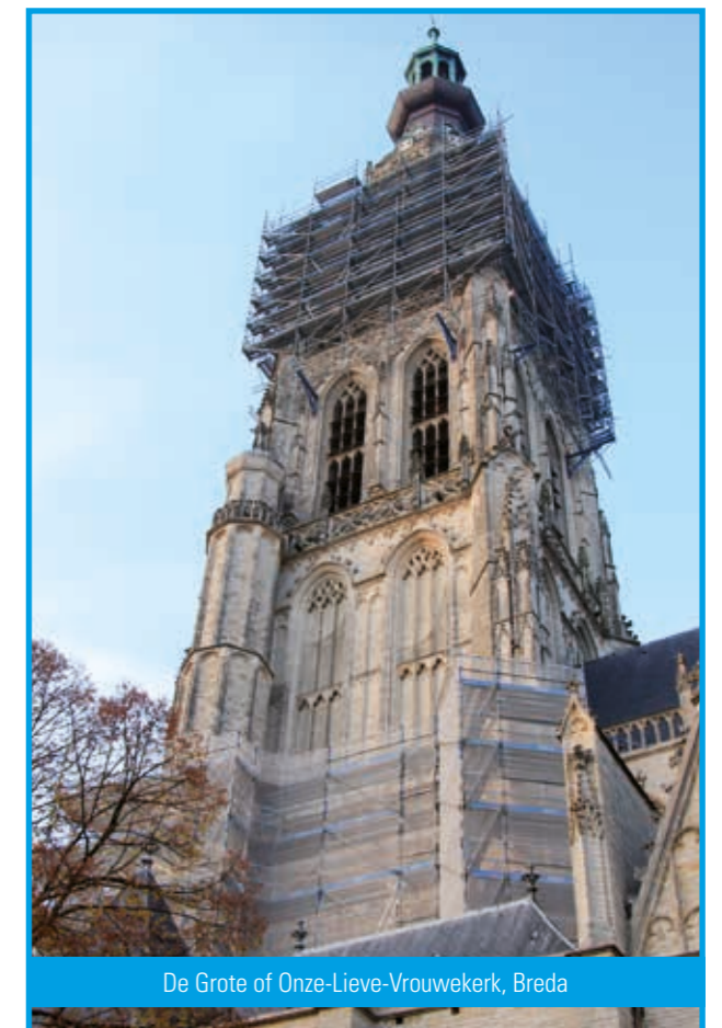
De Grote of Onze-Lieve-Vrouwekerk, Breda