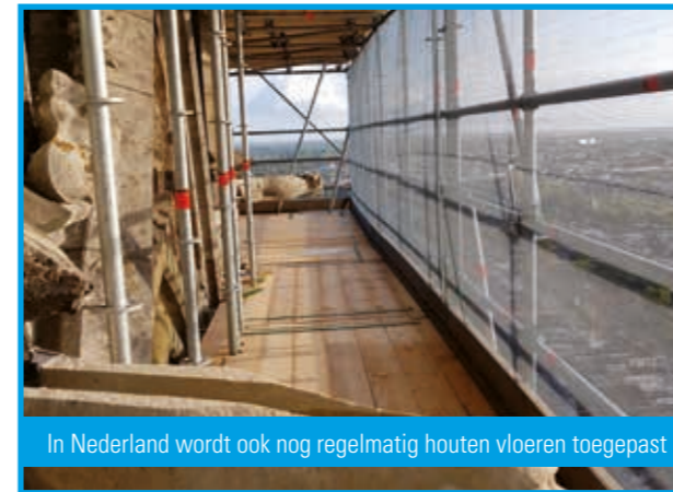
In Nederland wordt ook nog regelmatig houten vloeren toegepast