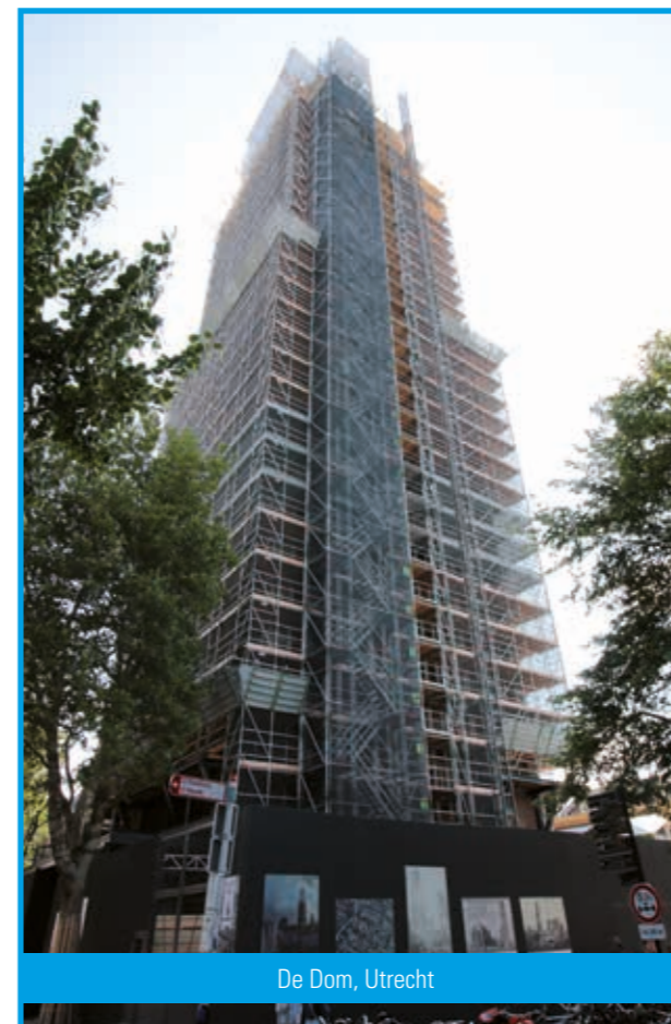
De Dom, Utrecht