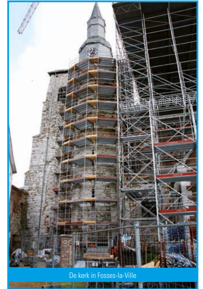
De kerk in Fosses-la-Ville