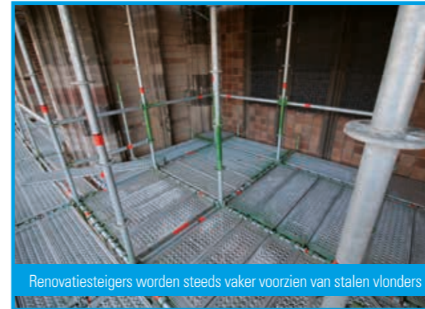
Renovatiesteigers worden steeds vaker voorzien van stalen vlonders