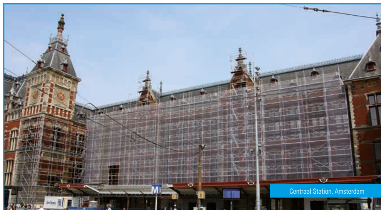
Centraal Station, Amsterdam

Op de volgende pagina's ziet u diverse restauratieprojecten. Naast woningbouw ook een selectie van historische gebouwen waarbij Allround- en Blitzsteigersystemen breed zijn ingezet. Bij veel renovatiewerkzaamheden wordt gebruikt gemaakt van Blitzsteigerconstructies. Vaak in combinatie met afschermssystemen.