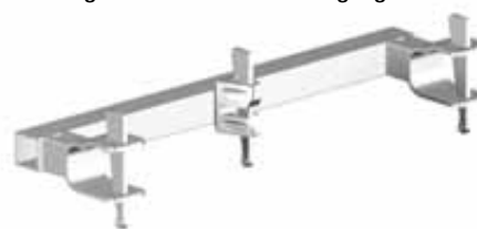
2666.030 Leuningklem dakrandbeveiliging