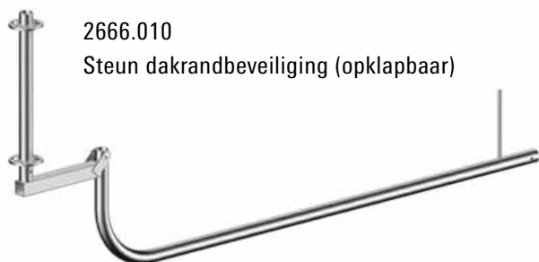
2666.010 Steun dakrandbeveiliging (opklapbaar)

Ballastblokken voorkomen het kantelen van de dakrand-leuningstaanders.