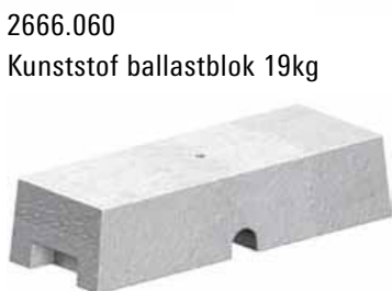
2666.060 Kunststof ballastblok 19kg