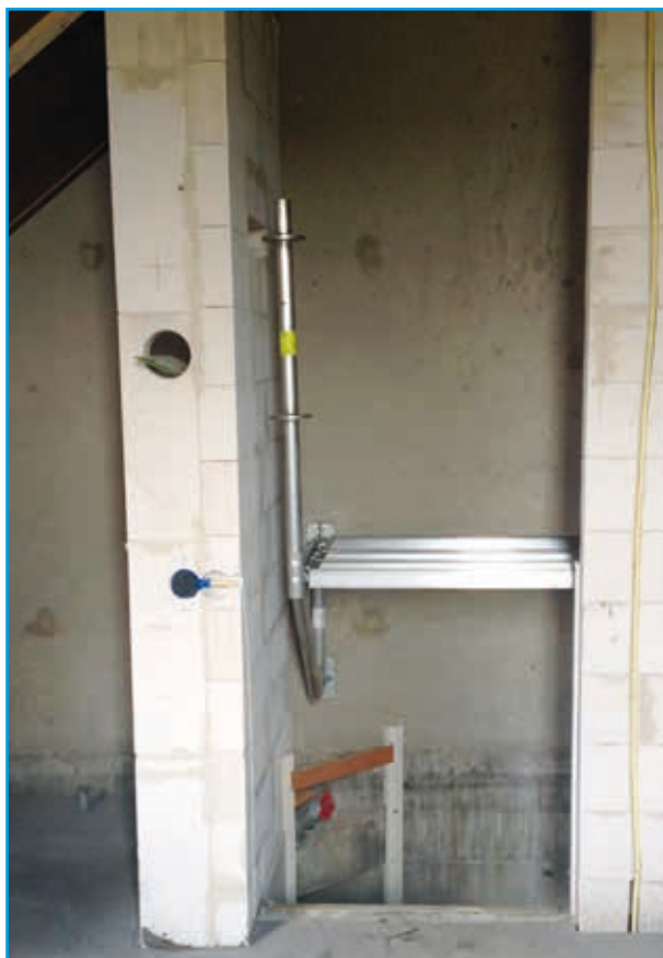
Trapgatconsole in gesloten trapgat

Instorthulzen h.o.h. 3.07 m. Bij eventueel gebruik van andere standaard Layher Allroundonderdelen de h.o.h.-systeemmaat van 2.07 m of 2.57 m aanhouden.