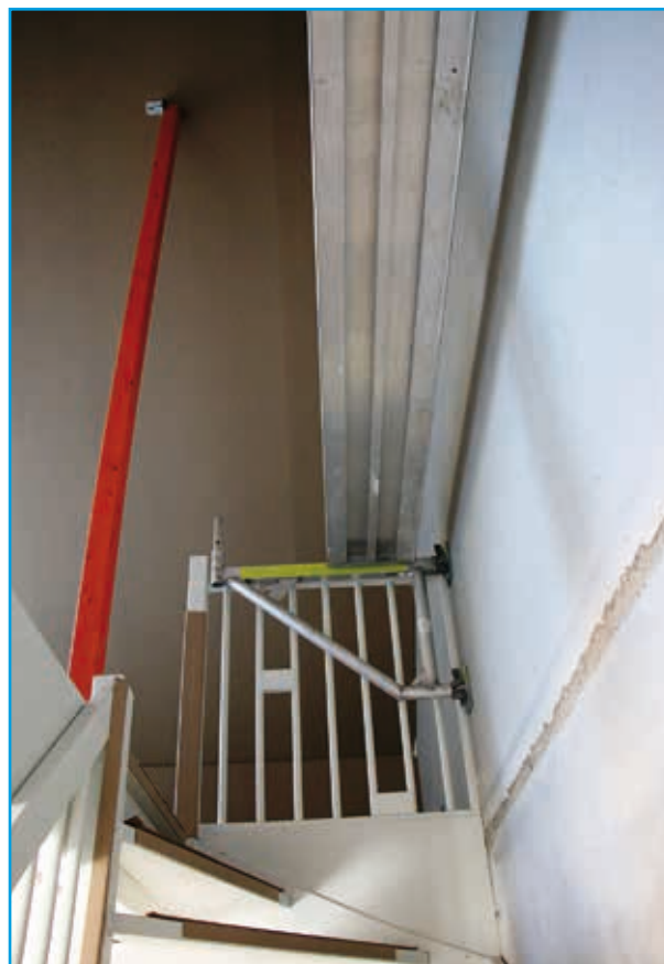
Trapgatconsole tijdens opbouw in open trapgat