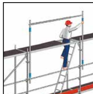
Montagebaluster T5 met 1 borgpen voor enkele leuning