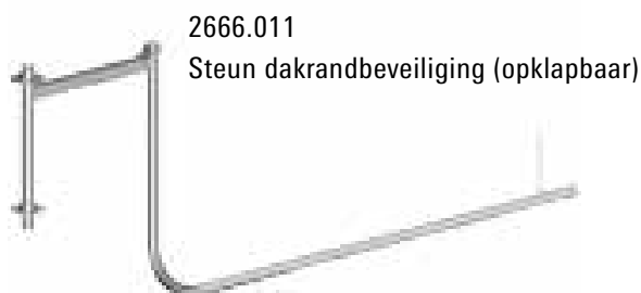
2666.011 Steun dakrandbeveiliging (opklapbaar)

De maximale lengte van de ligger (leuning) tussen twee leuningstaanders is 3.07 m. Ballastblokken voorkomen het kantelen van de dakrand-leuningstaanders.