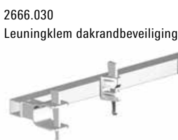
2666.030 Leuningklem dakrandbeveiliging