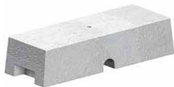
2666.060 Kunststof ballastblok 19kg