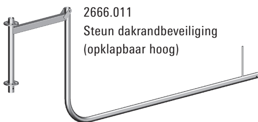
2666.011 Steun dakrandbeveiliging (opklapbaar hoog)