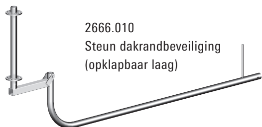
2666.010 Steun dakrandbeveiliging (opklapbaar laag)

De maximale lengte van de ligger (leuning) tussen twee leuningstaanders is 3.07 m. Ballastblokken voorkomen het kantelen van de dakrand-leuningstaanders.